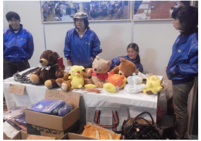
こしがや産業フェスタで多くの事業者と交流