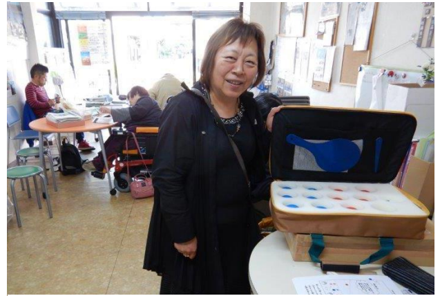
クリタエムデリカ社長からポッチャの贈り物