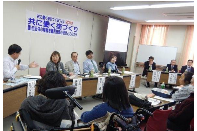
市や事業者と障害者で共に働く街を創るつどい